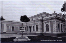
By the fountain, designed by architect L. Holmberg